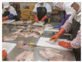
ヌメリ、ウロコ除去