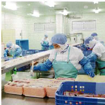
衛生的な環境の工場

さらに、現地生産者とのより緊密な関係を築き、メインとなる原料産地の、状況を早急に把握できるように努めております。