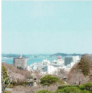
鹽竈神社から塩釜港と松島の島々を望む

奥州一宮として1,200年の歴史を誇る「鹽竈神社」の門前町「塩竈市」は、日本屈指の水揚げ漁港「塩釜港」を有する古くからのみなとまちでもあります。ヒットエスフーズは、豊かな海の幸に恵まれた、ここ塩釜で培われた伝統ある「日本の食文化」を大切に、確かな製品を創り続けています。