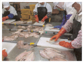
ヌメリ、ウロコ除去