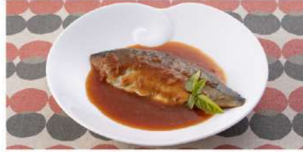
金華さばの トマトソース 煮込み