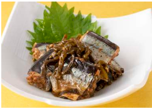
浅炊きさんま たらこ 昆布