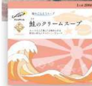
鮭のクリーム スープ