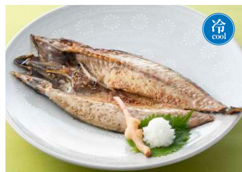
金華さばの みりん干し