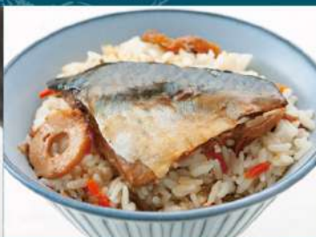
石巻金華釜飯 さば