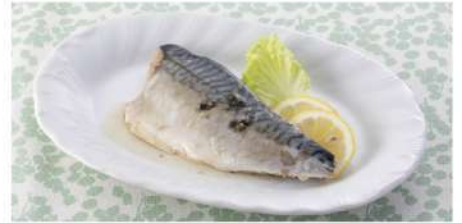
金華さばの グリーンペッパー オイル漬