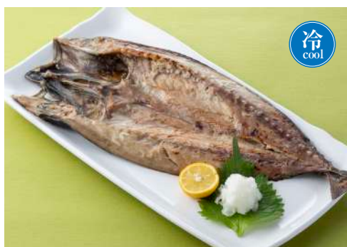
金華さばの 塩麹漬