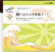
鯛つみれの 中華風スープ