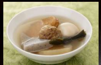
牛たんつくねおでん