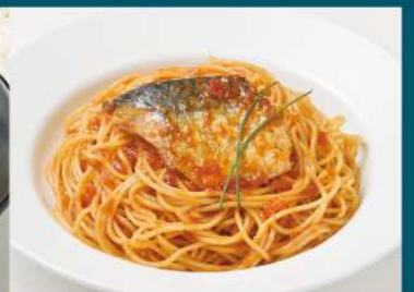
金華さばと野菜の トマトパスタソース