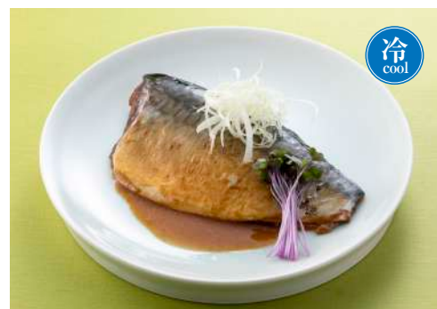
金華さばの 味噌煮