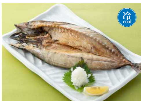
金華さばの 一夜干し