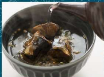
石巻金華茶漬け さんま