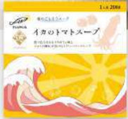
イカの トマトスープ