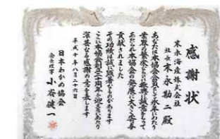
日本わかめ協会からの感謝状