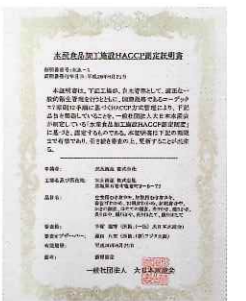
水産食品加工施設HACCP認定証明書