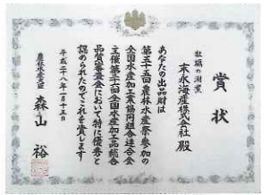
第26回全国水産加工総合品質審査会 優秀賞受賞