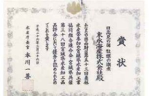
第38回宮城県水産加工品品評会 優秀賞受賞