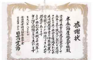
全国漁業協同組合連合会からの感謝状