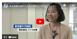
ダイジェスト動画(2022年)