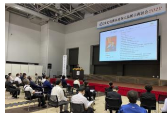
セミナー会場の様子(2022年)