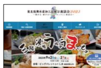
公式ホームページ(2023年)